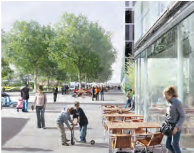
Un parc urbain pour la détente et la promenade