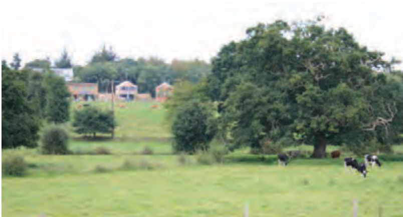
Inscription du projet dans la topographie

En fond de vallée, des chênes multiséculaires sont préservés. Les constructions s'implantent discrètement sous la ligne de crête, à mi-hauteur des frondaisons des arbres.