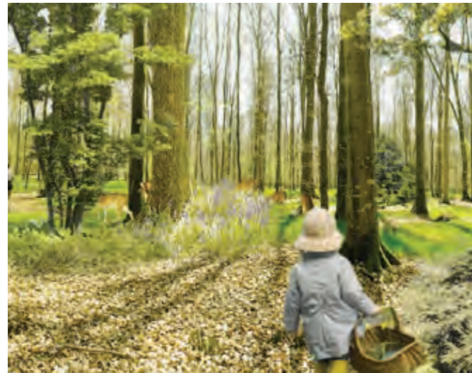
Un parc forestier alternant clairières et massifs plus denses