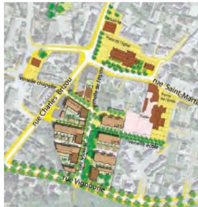
Plan de maillage des espaces publics du quartier

Le plan montre combien, en faisant apparaître le bâti et les structures végétales, l'espace public se dessine déjà.