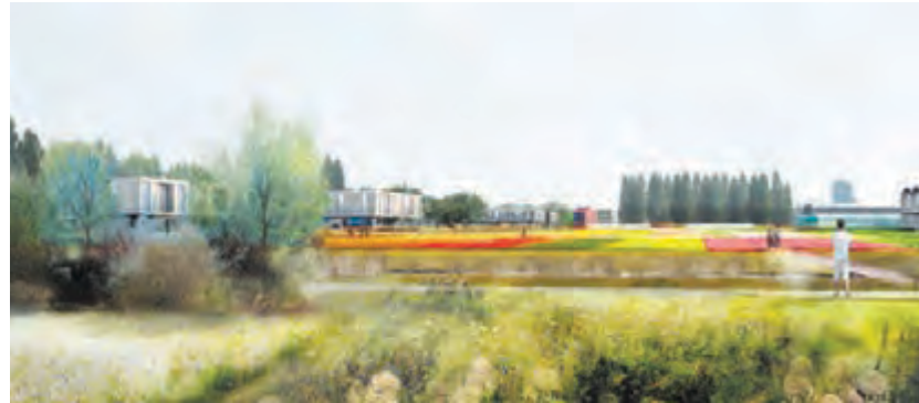
Un parc horticole, consacré à la production maraîchère de proximité

À Douai, plus d'un quart des 160 hectares du futur écoquartier sera consacré à des espaces de nature et de respiration. Ce projet, mêlant espaces ouverts et densité, s'appuie sur la complémentarité programmatique et paysagère de cinq parcs pour créer un cadre de vie inédit.