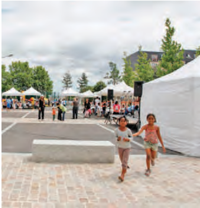
Garges-lès-Gonesse, la Muette

Une partie de la place Mandela est traitée en esplanade et peut accueillir plusieurs usages. Ici, elle reçoit stands et manèges.