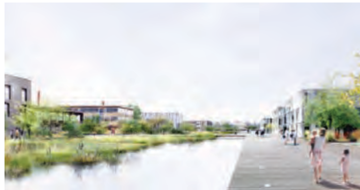
Un canal alimenté par les eaux de pluie de l'ensemble du quartier