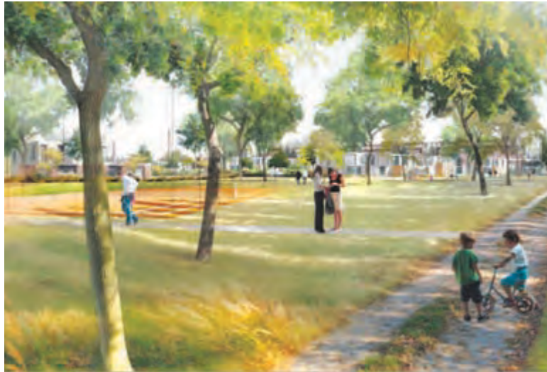
Un parc actif dédié aux sports et aux activités physiques