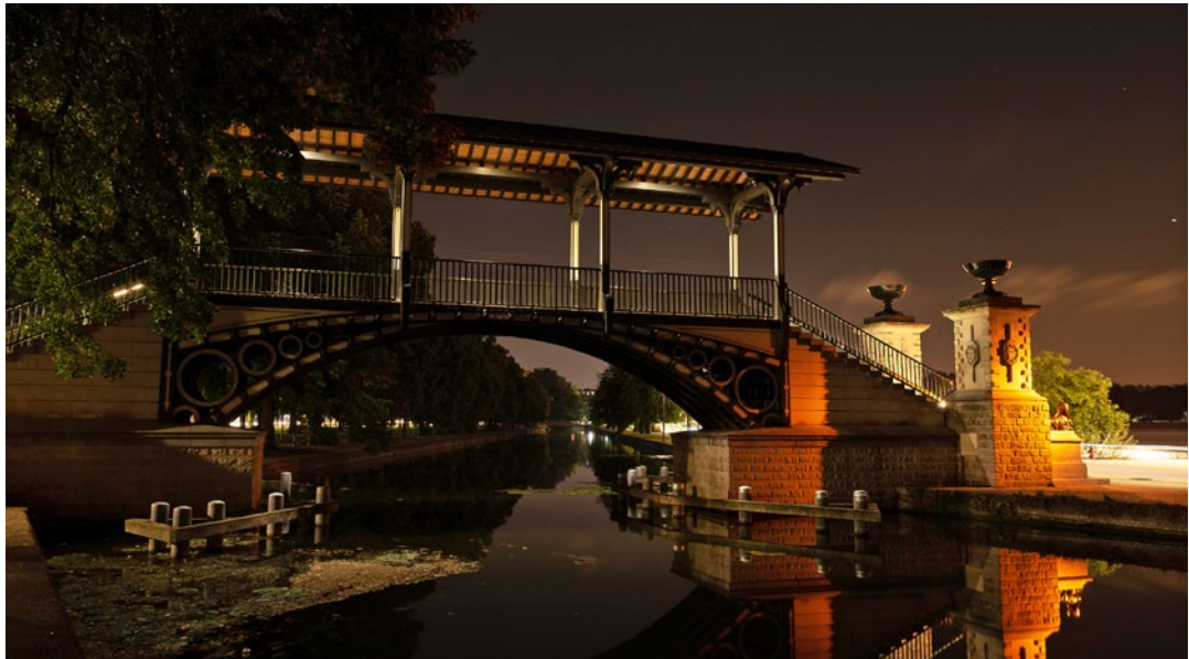
L'éclairage de mise en valeur du pont Napoléon, qui enjambe la Moyenne-Deûle à Lille, est encastré pour éviter l'éclairage direct de l'eau, et de couleur orangée pour limiter le dérangement de la faune nocturne

Elle s'adresse aux élus et techniciens des collectivités territoriales, gestionnaires, aménageurs et bureaux d'études des domaines de l'éclairage et de l'écologie, et aux gestionnaires d'espaces naturels.