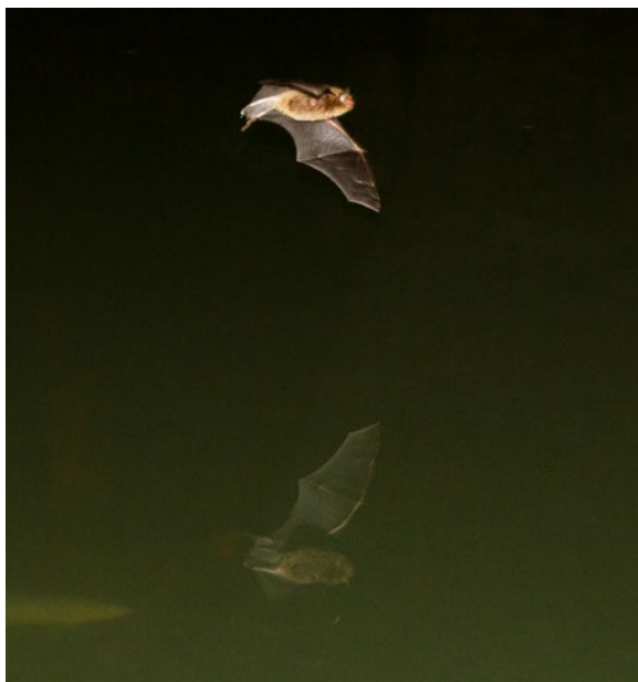
Chiroptère en vol. Les chiroptères sont particulièrement impactés par la pollution lumineuse

Cette publication est destinée aux décideurs, techniciens et professionnels concernés par la question: bureaux d'études, concepteurs lumière, fabricants, installateurs, urbanistes, aménageurs, écologues, etc.