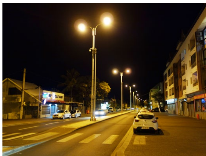
Installation d'éclairage urbain d'ancienne génération : que faudrait-il améliorer pour qu'il soit utile, maîtrisé et responsable ?

La responsabilité doit aussi concerner la prise en compte de l'ensemble du cycle de vie du matériel installé. Le remplacement de matériel encore parfaitement fonctionnel, ou l'installation de solutions technologiques dont les matériaux constitutifs nécessitent des processus extractifs polluants, et/ou sans solutions satisfaisantes de recyclage, devraient ainsi être des points questionnés dans les projets neufs ou de rénovation.