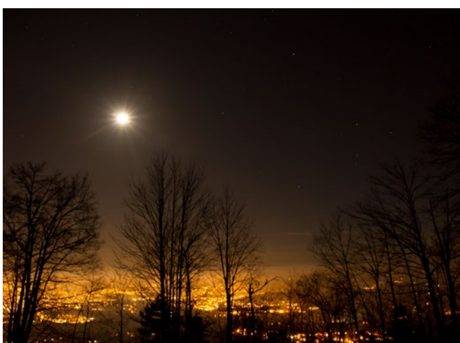
Lumières de la ville visibles depuis les espaces non urbanisés

Partant du principe que l'éclairage artificiel n'est par essence pas « naturel » et induit de fait une modification de l'environnement nocturne, un certain nombre de règles basiques peuvent être appliquées pour réduire ses effets négatifs quelle que soit la technologie considérée. Cela doit permettre une cohabitation nocturne plus harmonieuse entre l'Homme et les autres êtres vivants, dans une période où la biodiversité est particulièrement menacée. Ces règles, qui répondent aussi à d'autres enjeux comme la sobriété énergétique et la santé humaine, se fédèrent autour de la notion d'éclairage utile, maîtrisé et responsable.