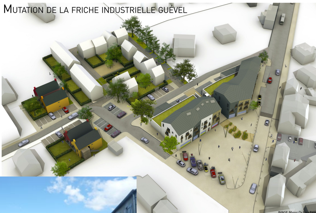
MUTATION DE LA FRICHE INDUSTRIELLE GUÉVEL

Il est composé de 50 logements dont 50 % de logements sociaux, d'environ 1.000 m 2 de surfaces commerciales et d'espaces publics, dont une placette centrale susceptible d'accueillir un marché forain. Les emprises spécifiques en rez-de-chaussée renforcent les fonctions commerciales du centre-bourg ; la proximité des services administratifs et des écoles favorisent une « vi(II)e des courtes distances ».