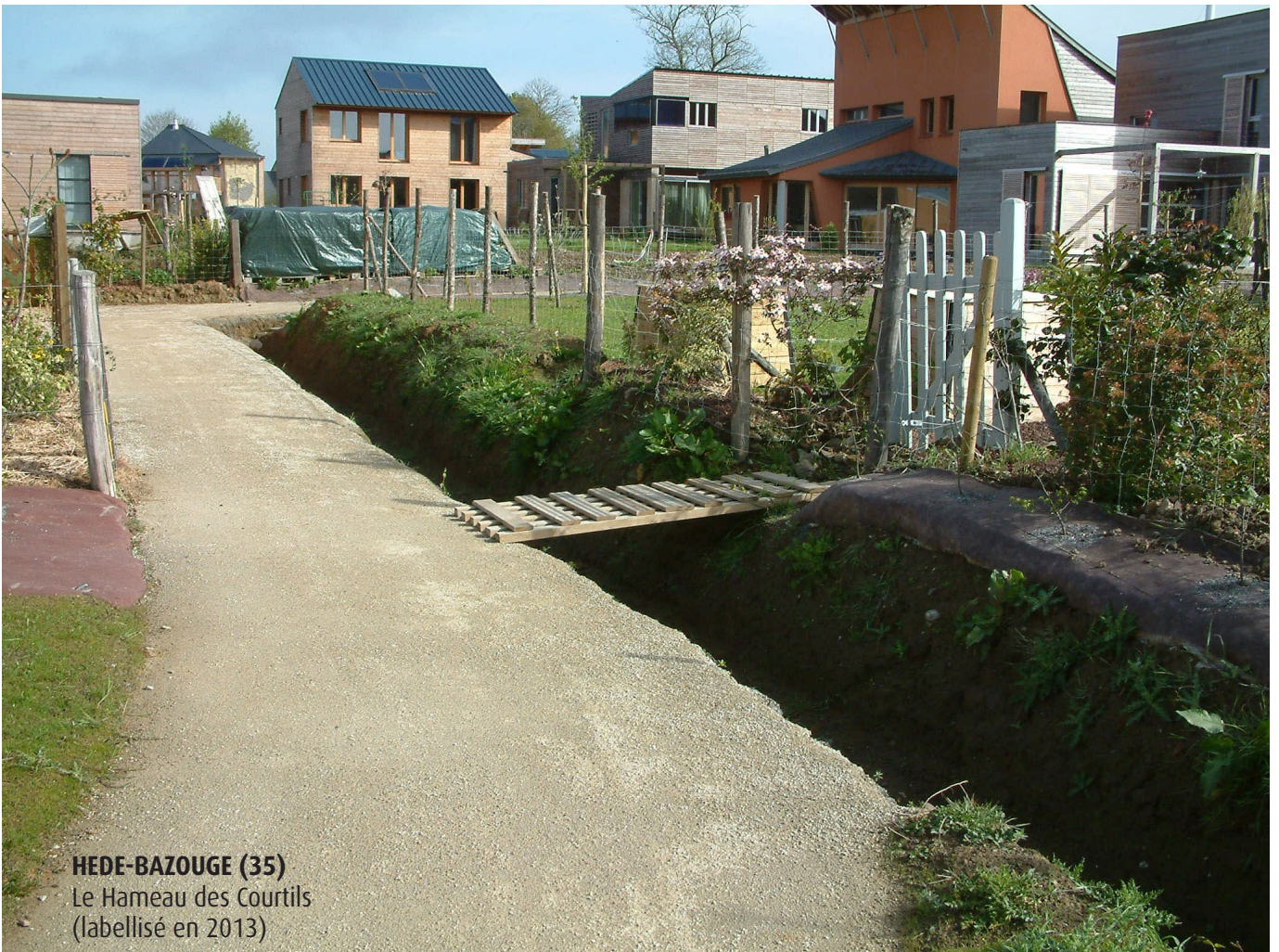
HEDE-BAZOUGE (35) Le Hameau des Courtils (labellisé en 2013)