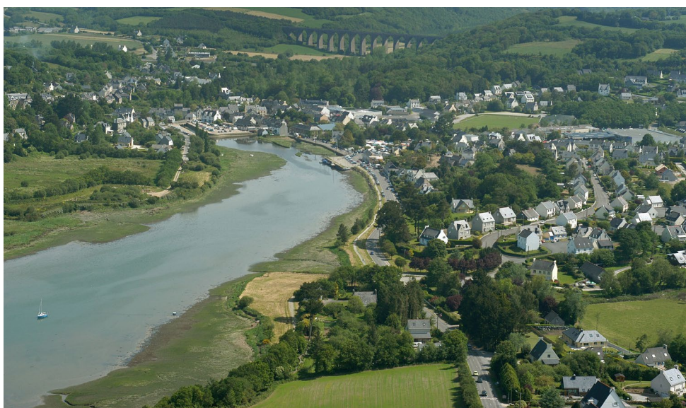
Le bourg de DAOULAS (29)

Le quartier du Pouligou s'inscrit désormais comme une des composantes d'urbanisation « durable » à l'échelle du centre-bourg, au même titre que la renaturation des zones humides, la création d'un refuge pour chauve-souris, l'amélioration de la continuité écologique des cours d'eau, la densification du bâti en cœur de bourg... Ce projet, initié par une action volontariste des élus de la commune et malgré des moyens humains et financiers limités, associe le plus possible les différents acteurs (habitants, commerçants...).