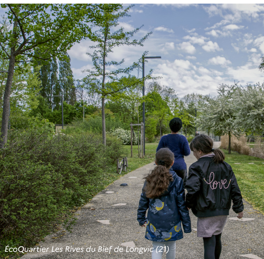
ÉcoQuartier Les Rives du Bief de Longvic (21)

84 ÉcoQuartiers situés en quartiers prioritaires de la politique de la ville